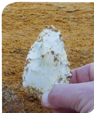
Silex taillé mis au jour lors de fouilles

**INRAP = Institut National de Recherches Archéologiques Préventives