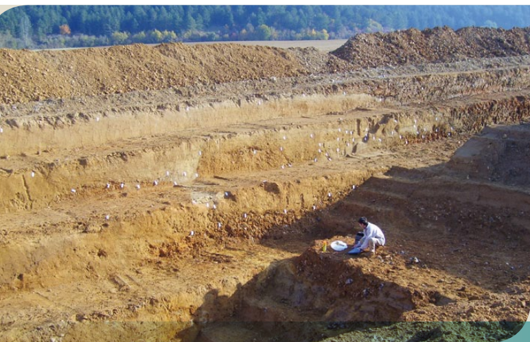
Plateau de fouilles archéologiques