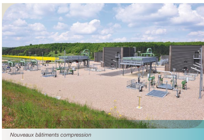
Nouveaux bâtiments compression

> Les installations de la station centrale font l'objet d'importants travaux de rénovation depuis 2009. Des électro-compresseurs de nouvelle génération ont été mis en service en octobre 2012. Cette technologie respectueuse de l'environnement permet de réduire significativement les émissions atmosphériques et de limiter les nuisances sonores.